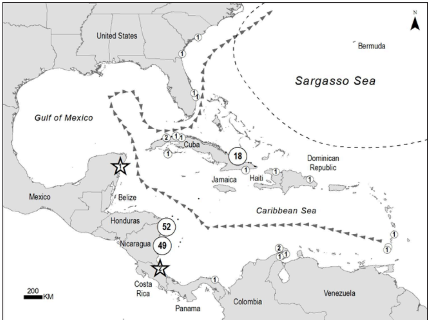
Figure 2. Distribución geográfica de marcas recuperadas de tortugas verdes inmaduras ( Chelonia mydas ) capturadas en las aguas de Bermuda en el Mar de los Sargazos (Actualizado de Meylan et al. 2011). Las estrellas indican los lugares donde tres tortugas marcadas en Bermuda fueron posteriormente registradas anidando (Meylan et al. 2014).

Tortuguero, Costa Rica (Meylan et al. 2014). Estos movimientos hacia sitios de alimentación y playas de anidación representan viajes de varios miles de kilómetros. También, evidencian la conectividad entre Bermuda (Mar de los Sargazos) con el Gran Caribe y quizás más notorio a medida que aumentan las tortugas marcadas que alcanzan su edad reproductiva.